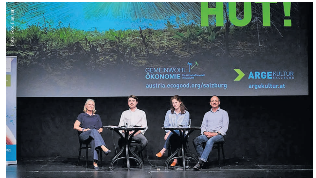
Gemeinwohlbericht ARGEkultur 2021/22

Gerade angesichts politisch unsicherer Zeiten sei die Ausrichtung wichtiger denn je. „Wenn man die Nachrichten einschaltet, sieht man, dass das Gemeinwohl gerade nicht im Mittelpunkt steht. Das erzeugt Widerstand und Müdigkeit zugleich.“ Für Linz ist die GWÖ-Ausrichtung damit auch ein politischer Ausdruck. „Es gehört zum politischen Handeln, dass man Sorge trägt für den Kontext, in dem man lebt und arbeitet. Wenn man genau schaut, gibt es viele Möglichkeiten zu handeln.“ Jeder, der etwas tun will, solle nach Möglichkeiten suchen: „Tun ist aber nur dann gut, wenn man es reflektiert tut und weiß, warum. Und da bietet einem die GWÖ eine gute Vorlage, weil man sehr genau über sein eigenes Handeln nachdenken muss.“