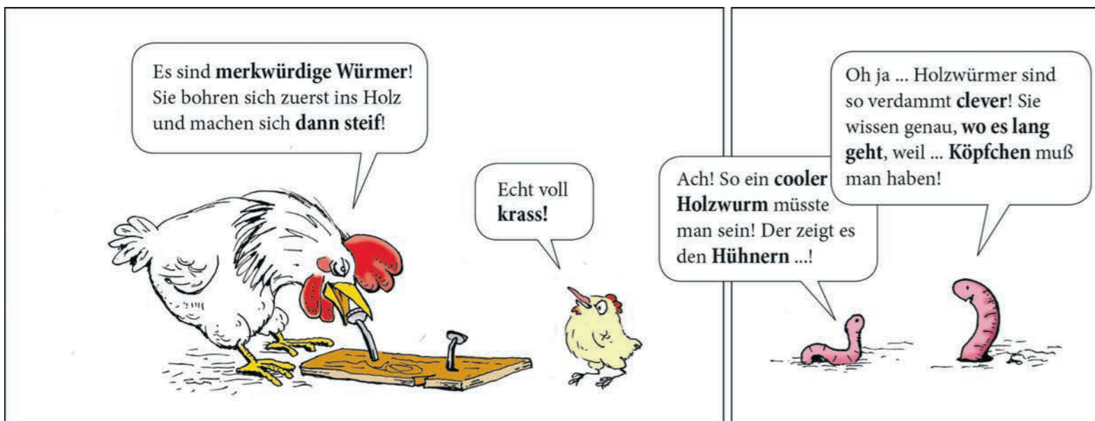
Der APROPOS-Cartoon von Arthur Zgubic©