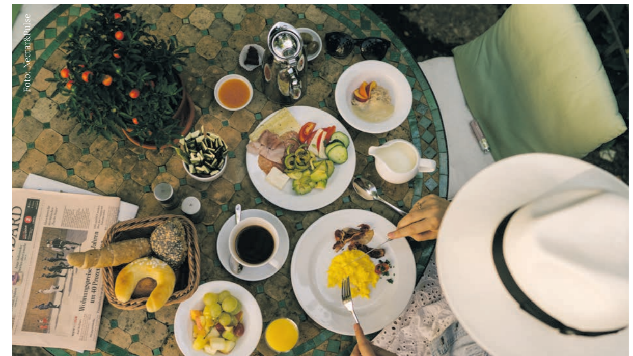
Es ist genug für alle da. Wirtschaftlicher Erfolg und die Ausrichtung am Gemeinwohl schließen sich nicht aus.